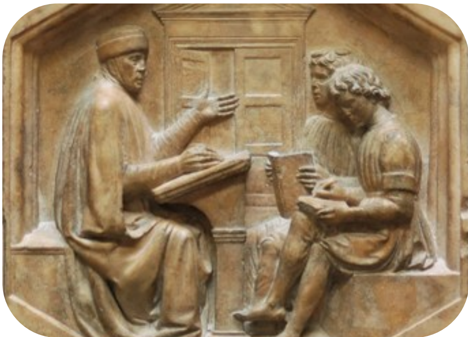
Priscianus Grammaticus (Museo dell'Opera del Duomo, Florencia)